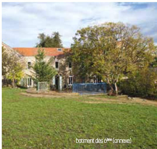
bâtiment des 6 èmes (annexe)

Au collège chaque niveau de classe a son propre bâtiment.