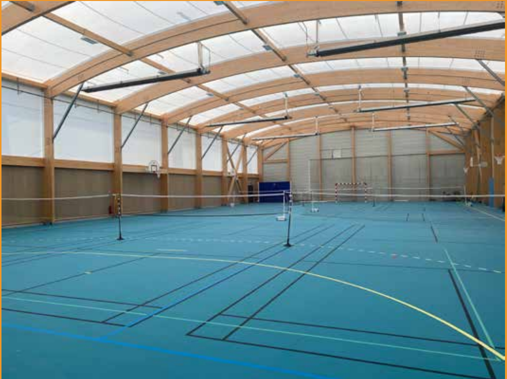
Nouveau gymnase du collège